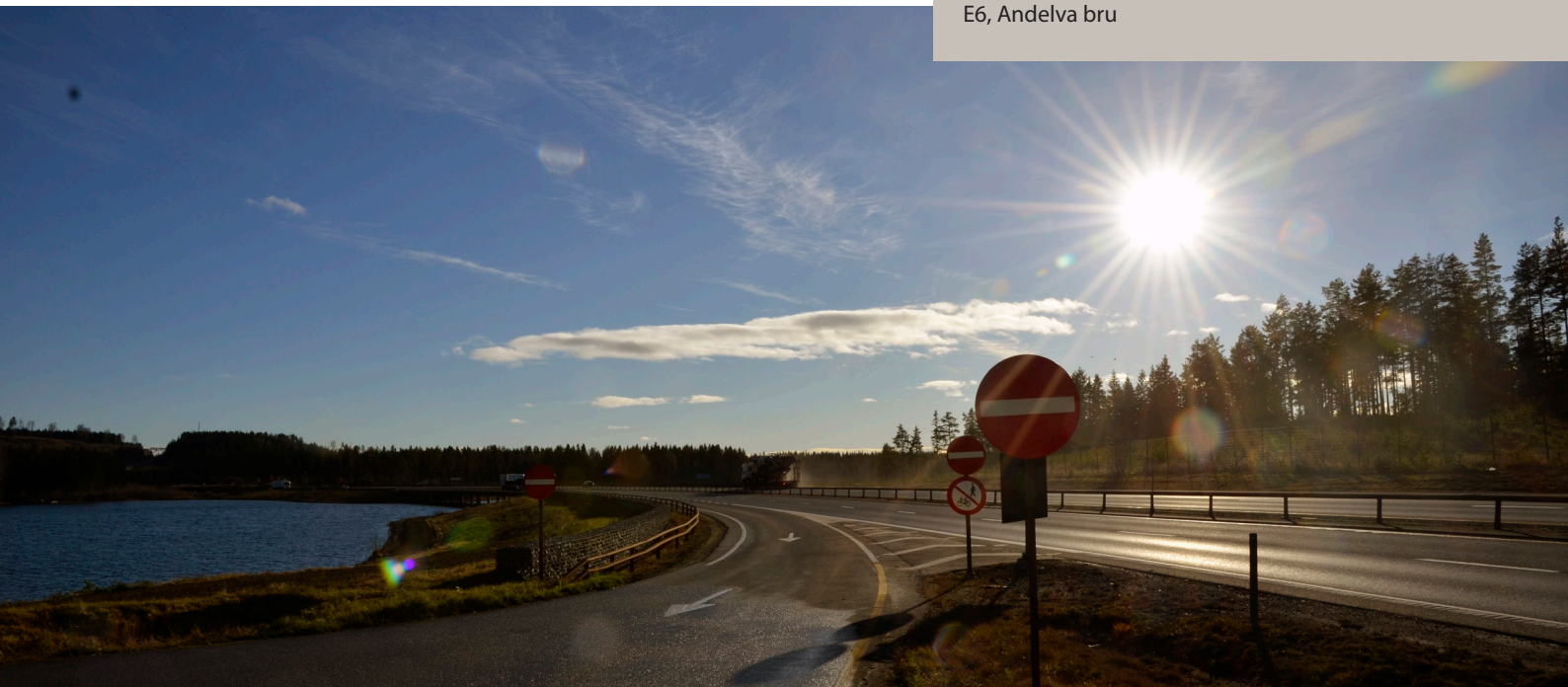
E6, Andelva bru

For etterlevelse av krav til formidling av generell sikkerhetsinformasjon etter kommisjonsdelegert forordning 886/2013 ble det ført tilsyn med Statens vegvesen og NRK. Det ble ikke gjort funn i tilsynssakene.