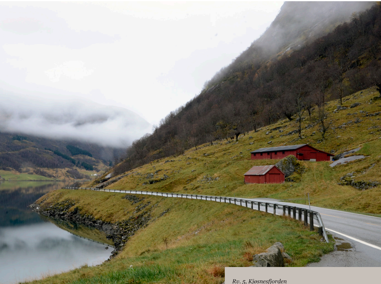
Rv. 5, Kjosnesfjorden