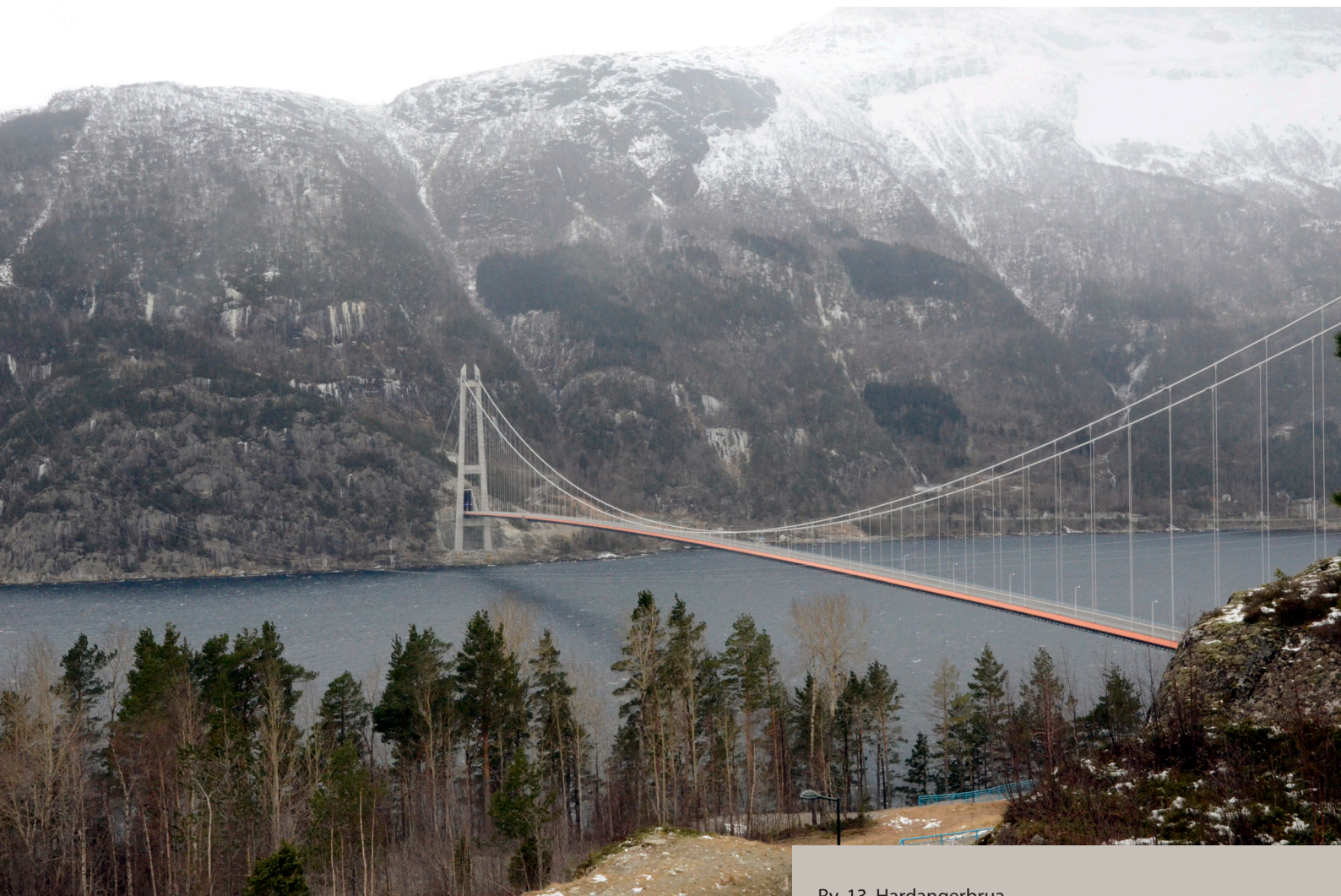
Rv. 13, Hardangerbrua