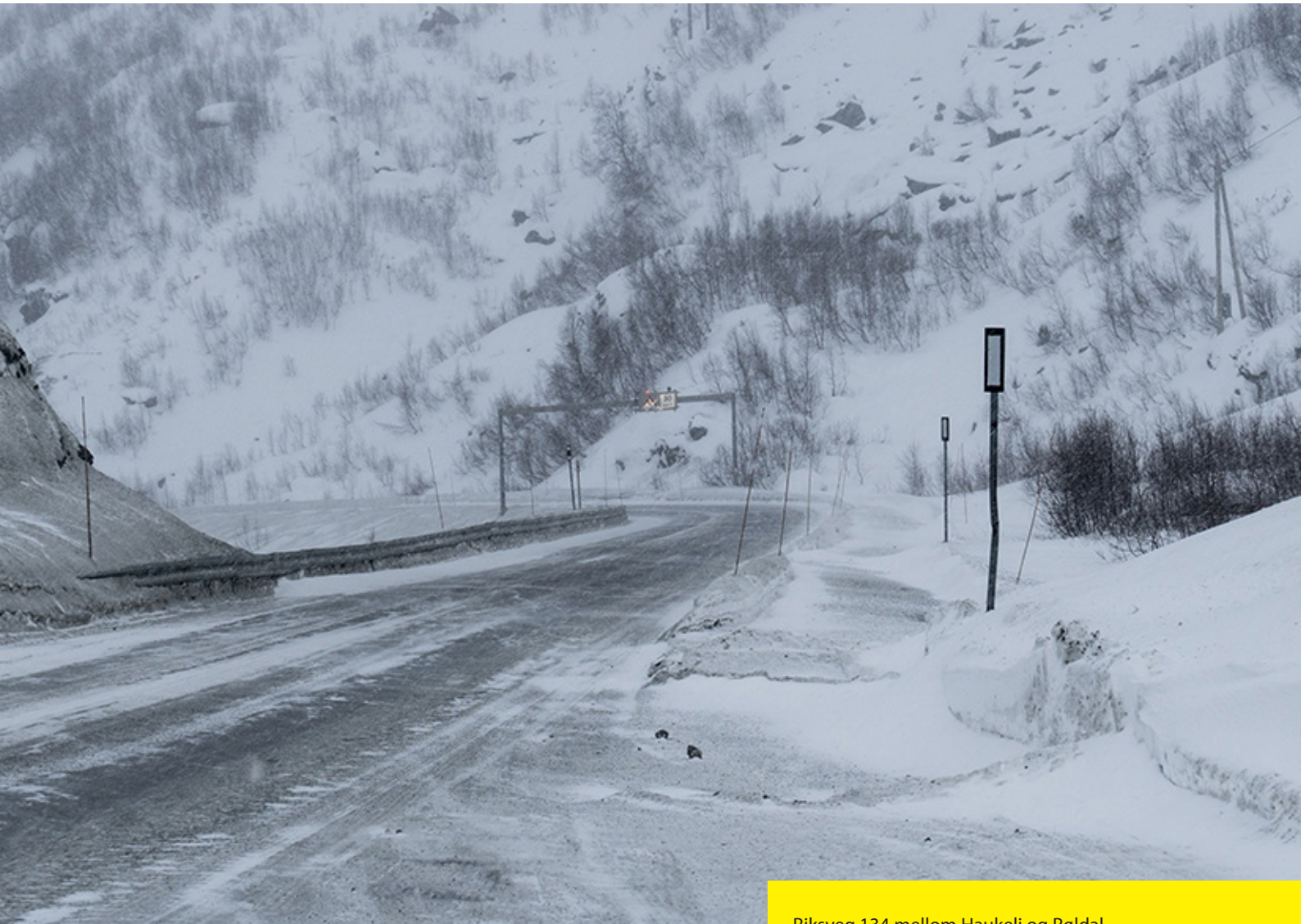
Riksveg 134 mellom Haukeli og Røldal

Oppstillingen av artskontorapporteringen har en øvre del som viser hva som er rapportert til statsregnskapet etter standard kontoplan for statlige virksomheter, og en nedre del som viser eiendeler og gjeld som inngår i mellomværende med statskassen. Artskontorapporteringen viser regnskapstall virksomheten har rapportert til statsregnskapet etter standard kontoplan for statlige virksomheter. Virksomheten har en trekkrettighet på konsernkonto i Norges Bank. Tildelingene er ikke inntektsført og derfor ikke vist som inntekt.